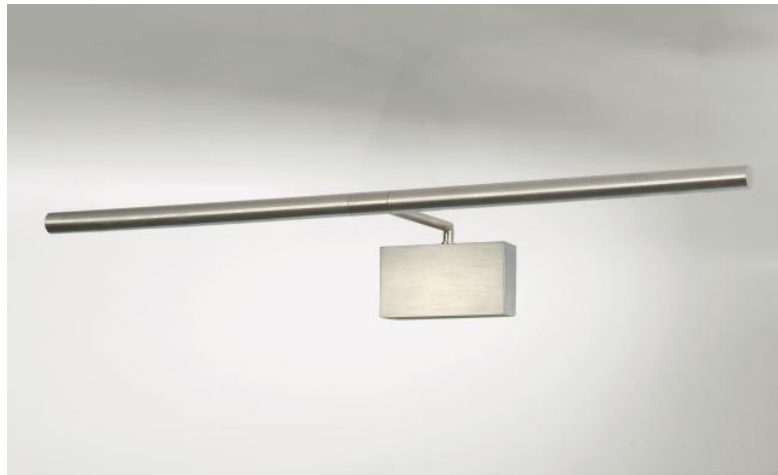
MEROE 53 en nickel satiné. Finition du métal : code 33