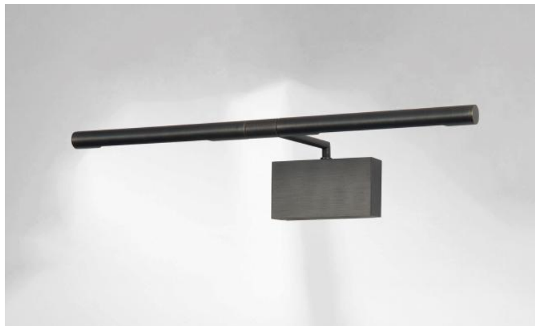
MEROE 40 en bronze griffé. Finition du métal : code 29