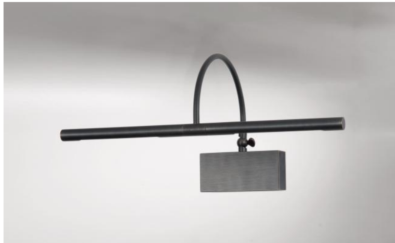
PACHED 40 en bronze griffé. Finition du métal : code 29