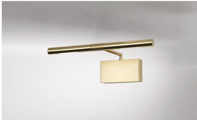
MEROE 25 en laiton (poli et satiné). Finitions du métal : code 20