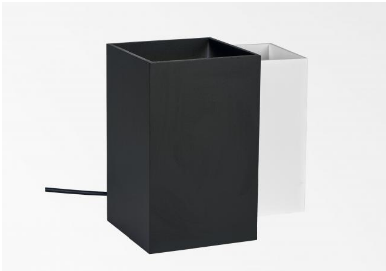
UP 111 en noir et blanc structuré