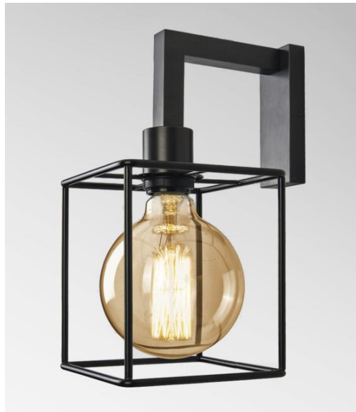
MESSENGER en bronze griffé avec structure KERMA en époxy noir et ampoule GOLD Ø125mm