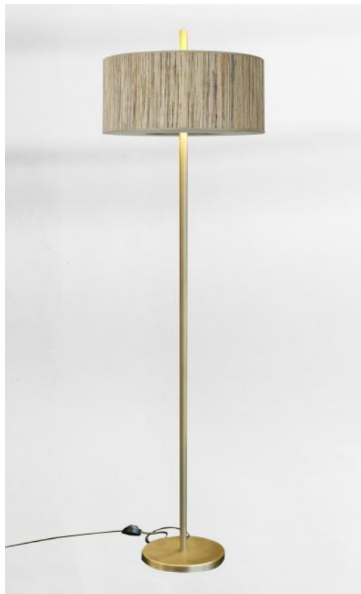
MALLAWI FLOOR in leicht Bronze mit Lampenschirm in Jacinthe Naturelle (Material aus Kategorie 5)