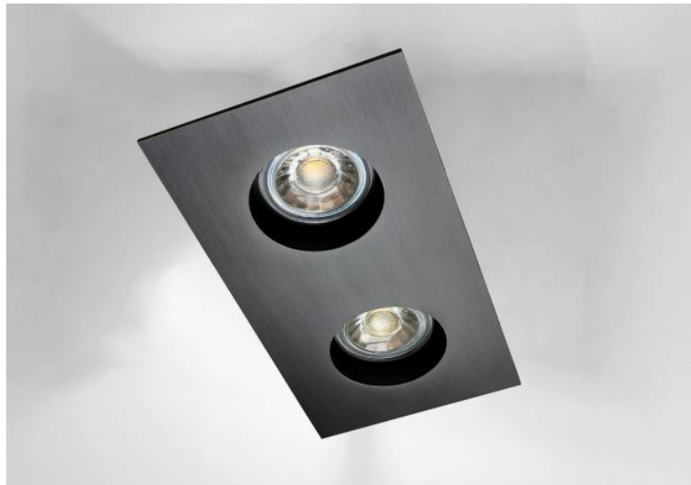
RIVERSIDE 2 in gebürstet Bronze. Metalloberfläche Code: 29