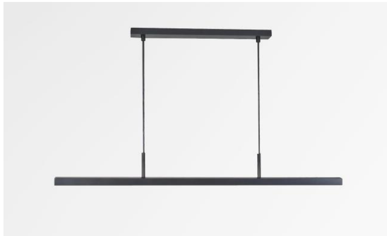
POLARIUS 90 in gebürstet Bronze