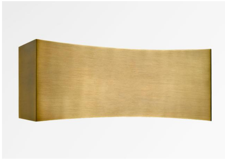
PHOBOS in leicht Bronze. Metalloberfläche Code: 28