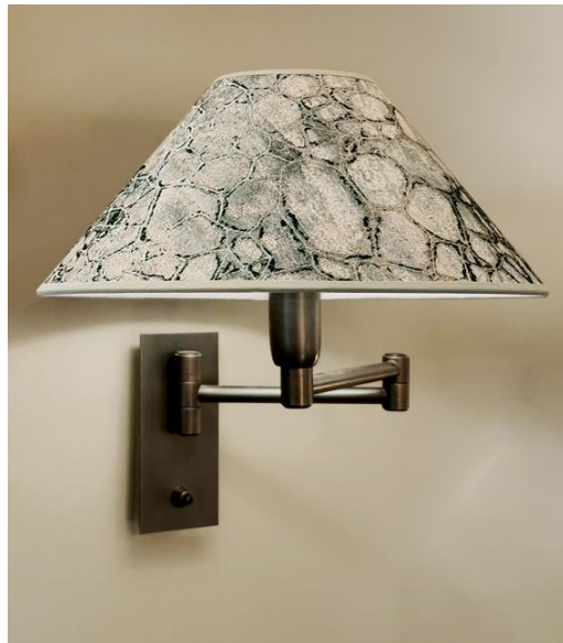
AHMOSIS +SW in gebürstet Bronze mit Lampenschirm Tilia Gravière (Stoffe aus Kategorie 5)