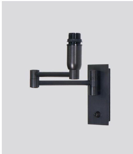
AHMOSIS +SW in gebürstet Bronze ohne Lampenschirm