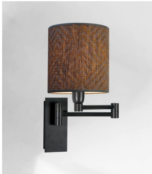
AHMOSIS -SW in gebürstet Bronze mit Lampenschirm in Arrow Casamance (Stoffe aus Kategorie 4)