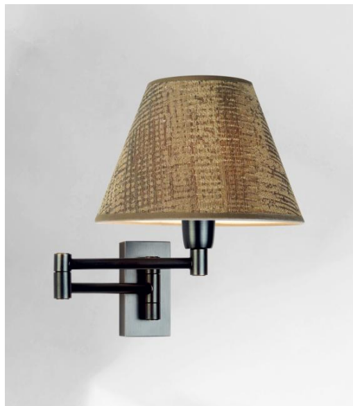
MAMMISI -SW in gebürstet Bronze mit Lampenschirm in Wilg Wengé (Stoffe aus Kategorie 3)