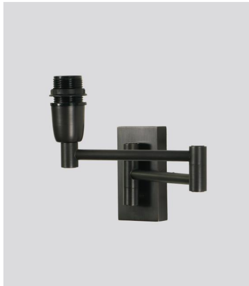
MAMMISI -SW in gebürstet Bronze ohne Lampenschirm