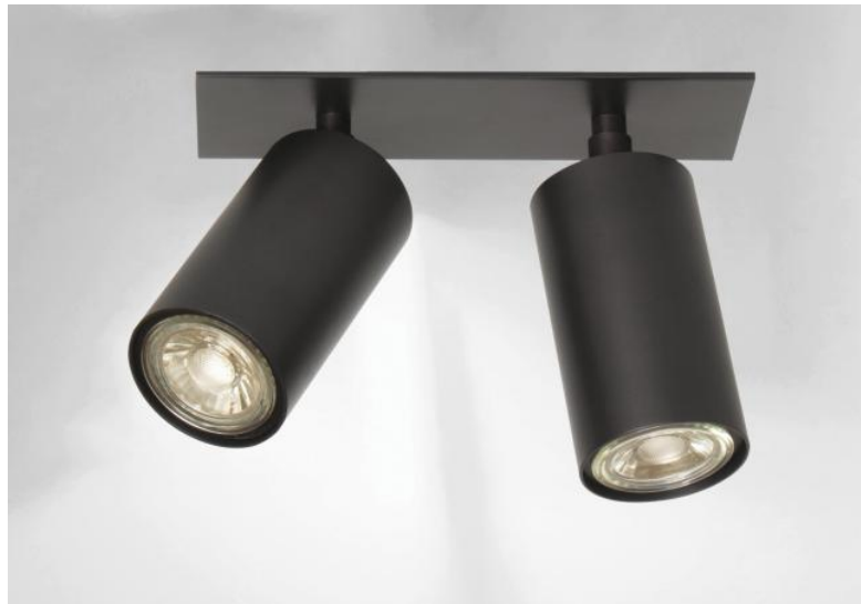
DEIMOS P2 # in gebürstet Bronze. Metalloberfläche Code: 29