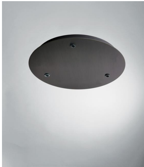
CEILING BASE 3 o20 in gebürstet Bronze. Metalloberfläche Code: 29. Optionen: eine große Auswahl an Kabeln und Fassungen (+Supplement)