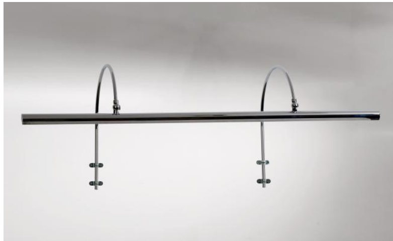
TRIANON 80 in Nickel poliert (Option). Metalloberfläche Code: 34