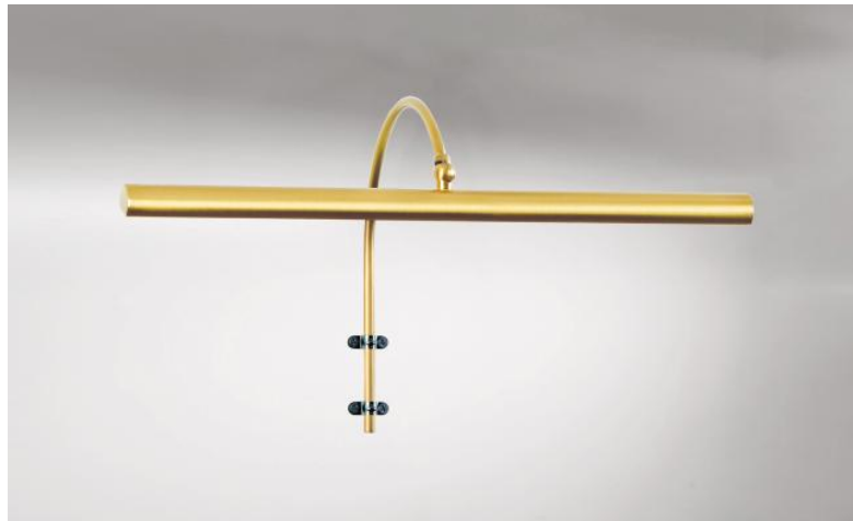
TRIANON 40 in gebürstet Messing. Metalloberfläche Code: 25