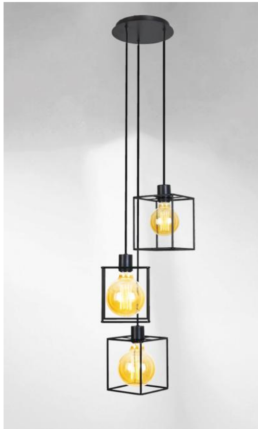
KERMA 3 o20 in gebürstet Bronze mit Strukturen in schwarzem Epoxy