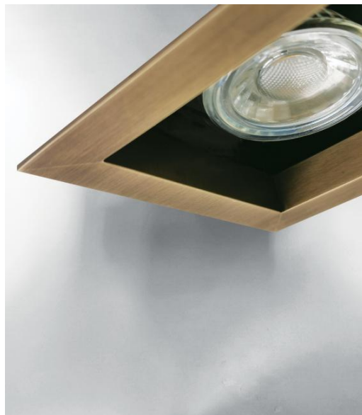
OURANOS 1 in leicht Bronze. Metalloberfläche Code: 28. Innen in strukturiertem Schwarz