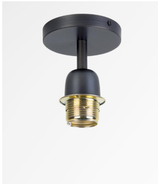
KENTIKA E27 in gebürstet Bronze