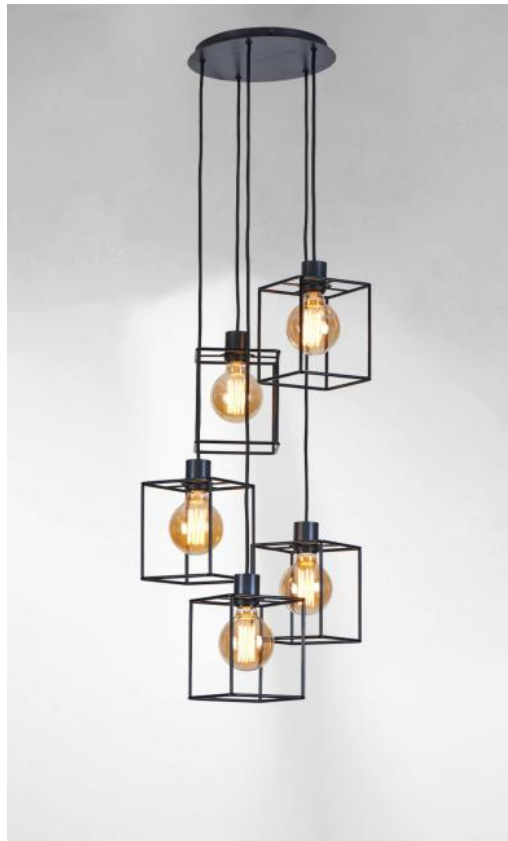
KERMA 5 o26 in gebürstet Bronze mit Strukturen in schwarzem Epoxy