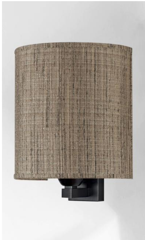
AMADA in gebürstet Bronze mit Lampenschirm Turda Châtain (Kat.3)