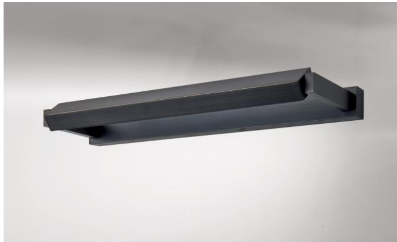
ERATO 35 in gebürstet Bronze. Metalloberfläche Code: 29