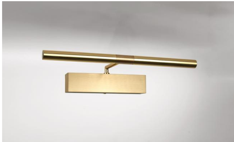
MEIDOU M 35 in Messing (poliert und gebürstet). Metalloberfläche Code: 20