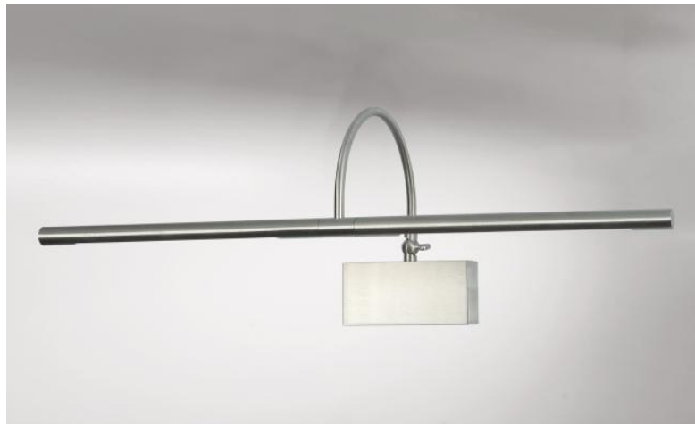
PACHED 53 in gebürstet Nickel. Metalloberfläche Code: 33