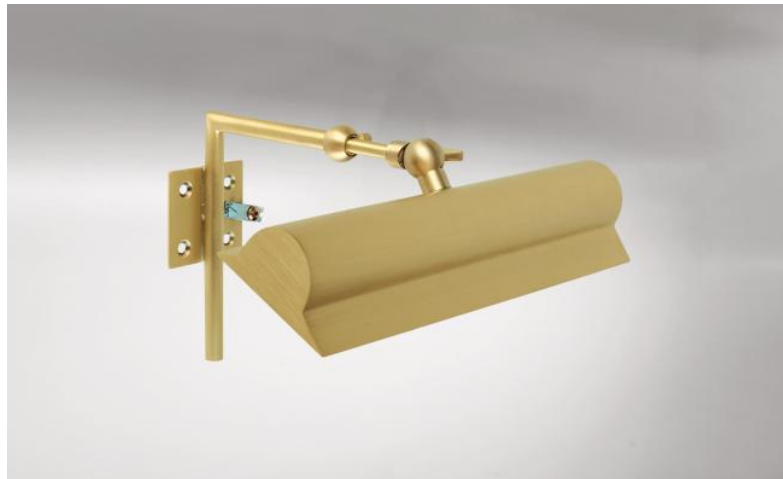
ET 22 in gebürstet Messing. Metalloberfläche Code: 25